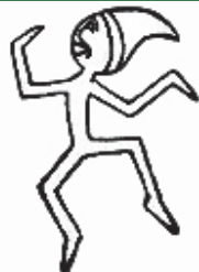
Ensines (Rojos) ¡Ensines nos llaman y respondemos, Felices de hacer lo que debemos!