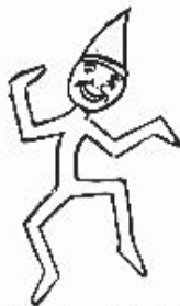
Ondinas (Azules) ¡Ondinas somos y ondinas seremos, y en los demás, siempreharemos!