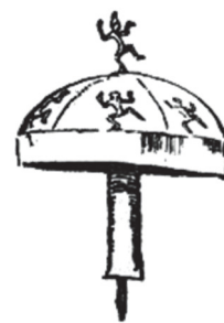
El hongo de los Alebrijes

Existen muchos tipos de Alebrijes, como Anjanas, Ondinas, Campanitas, Silfos, Ensines, Arienes, Pixies, Leprechaunes, Tontems, Lutines y Koboldos. Los Chaneques son gente pequeña que no hace nada bueno – son feos y ruidosos, sucios y envidiosos – así que no hay cabida para los Chaneques entre los Alebrijes.