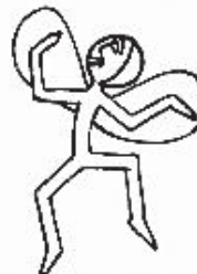
Campanitas (Blancas) ¡Nosotras Somos las Campanitas, y labores hacemos en nuestras casitas!

Es importante al formar las Cuadrillas el explicarles de dónde surgen los nombres.