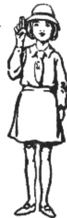
Se saluda aún sin uniforme

El saludo es otro signo de que es un Alebrije, aun cuando no esté vestido con el uniforme y si reconoce a una persona como un Alebrije, así es como le debe de saludar.