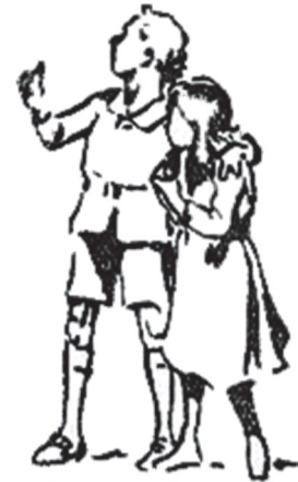
A buscar a la Lechuza

Le pidieron a su mamá que les dijera como podían encontrar un Alebrije, y ella les dijo que para encontrar uno tenían que encontrar a la vieja y sabia Lechuza para preguntarle, ya que ella conocía todo sobre estas criaturas tan buenas y podía decirles donde encontrar alguna.