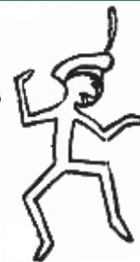
Silfos (Amarillo) ¡Somos los Silfos y somos muy buenos, siempre ayudando a los que podemos!