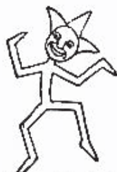
Anjanas (Verdes) ¡Nosotras somos las buenas Anjanas, Sin temor ayudando siempre con ganas!