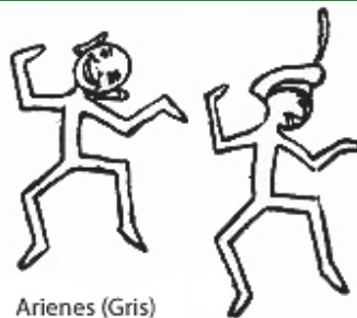
Arienes (Gris) ¡El mundo nos llama Tiempos Arienes, y el trabajo nos gusta y nos entretiene!