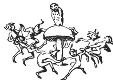
El círculo de baile

Se le llama el Círculo de Charlas, porque el Pueblo Mágico puede escuchar la voz y las sabias palabras de la Vieja Lechuza.